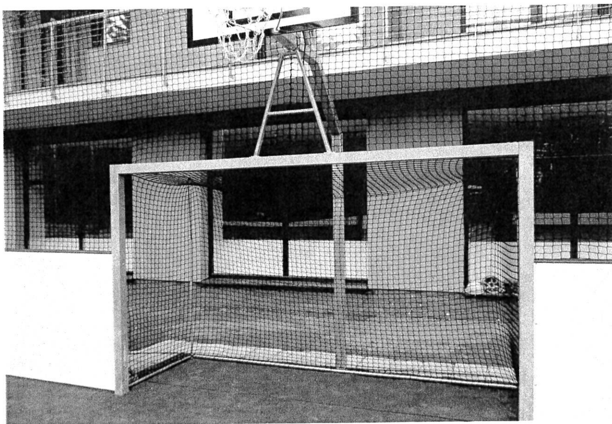
Ilustr. obr. mantinelov z fínskej preglejky

Nové dosky z fínskej vodovzdornej preglejky tmavohnedej farby vrátane dopravy a montáže 1261,50 eur bez Dph , doplnenie jedného vstupu pre hráčov +212,- Eur bez Dph