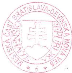
Dárius Krajčír starosta mestskej časti Bratislava Devínska Nová Ves