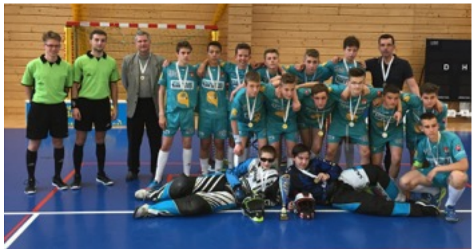
Starší žiaci - strieborní na Majstrovstvách Slovenska v Košiciach

vzbudzujeme rešpekt a v celoslovenskom porovnaní určite patríme medzi najúspešnejšie družstvá.