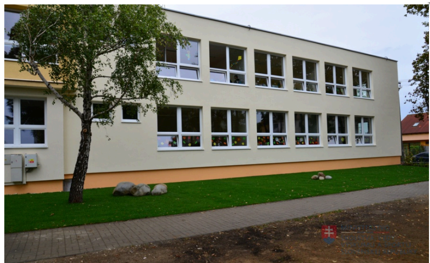
Ivánka pri Dunaji