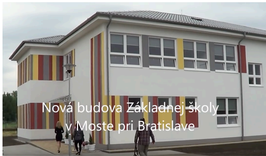
Nová budova Základnej školy v Moste pri Bratislave